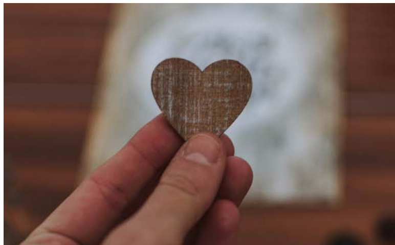
« Une cause qui me tient à coeur » avec l'appel à projets 2020

Les projets présentés par des collaborateurs et des membres de la famille DAHER ont porté sur le décrochage scolaire, l'aide à l'insertion par la formation professionnelle et l'accompagnement des personnes handicapées vers l'emploi. Les candidatures vont être étudiées par un jury qui désignera jusqu'à 10 lauréats en janvier 2021. Les collaborateurs et la famille DAHER désigneront ensuite le prix ONE DAHER doublant la dotation déjà accordée à l'un des projets lauréats. Rendez-vous en janvier !