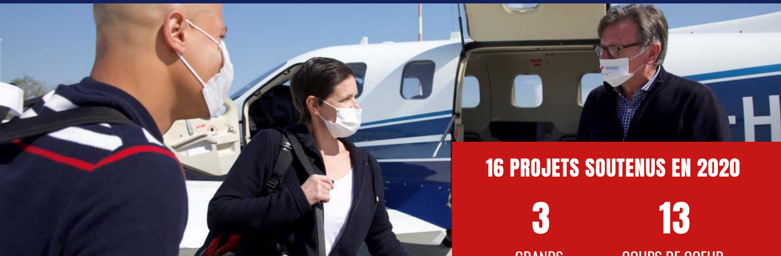
DAHER et FondaHer réunis dans l'urgence avec ASF face au Covid-19. Voir P.4