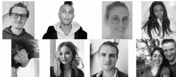
La 5ème promotion du LAB constituée de 8 jeunes créateurs d'entreprise.

Un créateur d'entreprise issu de la 4ème promotion du LAB