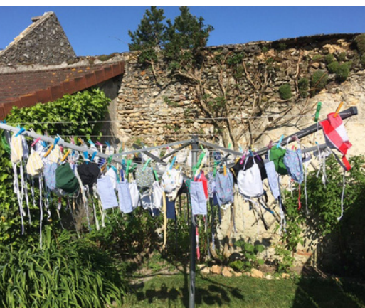
Les masques confectionnés pour Emmaüs Bougival