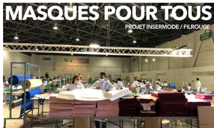
Insermode dans le cadre de l'opération "Masques pour tous"

Dès les premières heures du confinement, le fabricant de vêtements français Fil Rouge et l'atelier chantier d'insertion Insermode ont été sollicités par la Métropole Aix-Marseille-Provence pour produire rapidement et massivement des masques en tissu réutilisables. Insermode a fabriqué 1,35 million de masques en y associant des personnes en insertion débouchant sur la création de 50 postes. Cette initiative a bénéficié du soutien de Fondaher dans son plan d'urgence Covid-19.