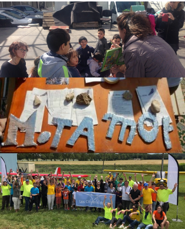
Les actions initiales entreprises par les projets en 2019 avant le Covid-19 / De haut en bas : ATD-Quart Monde, Mot à Mot et Les Citoyens du Ciel

Directement touchées par la crise, de nombreuses associations soutenues par Fondaher en 2019 ont rapidement réinventé leurs projets pour mieux agir.